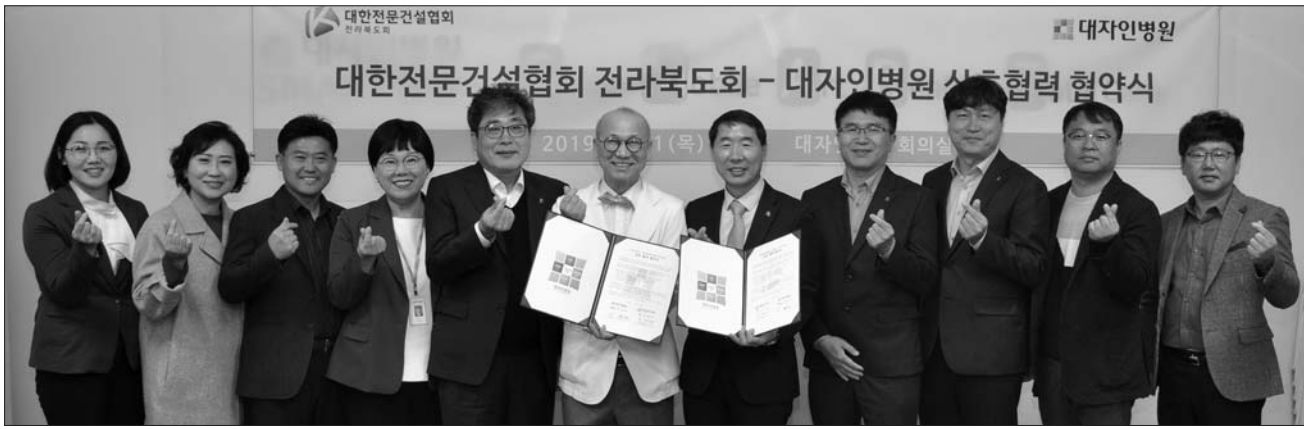
대한전문건설협회 전라북도회와 대자인병원이 21일 대자인병원 회의실에서 상호발전과 더불어 지역사회 복지증진을 위해 업무협약을 체결했다.