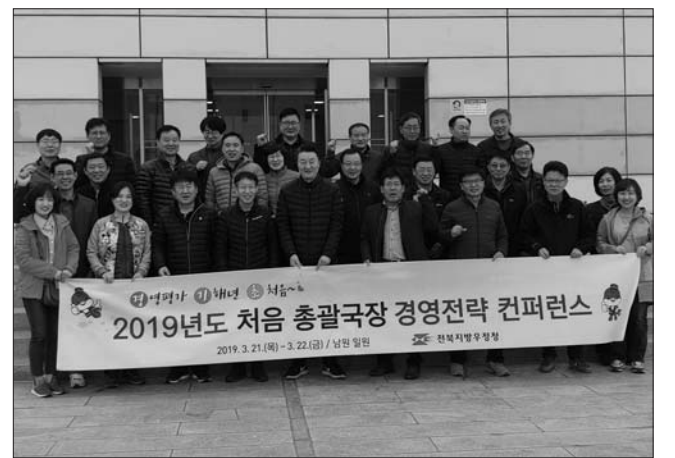
전북지방우정청이 3월 21일, 3월 22일 2일간 총괄국장과 우정청 간부 등 40여명이 참석한 가운데 2019년도 제1회 경영전략 컨퍼런스를 개최했다.