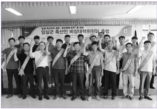
비상대책위원들은 "정부에서 추진 중인 부정청탁금지법 및 농협법 개정은 축산업 말살 정책"이라고 소리를 높였다