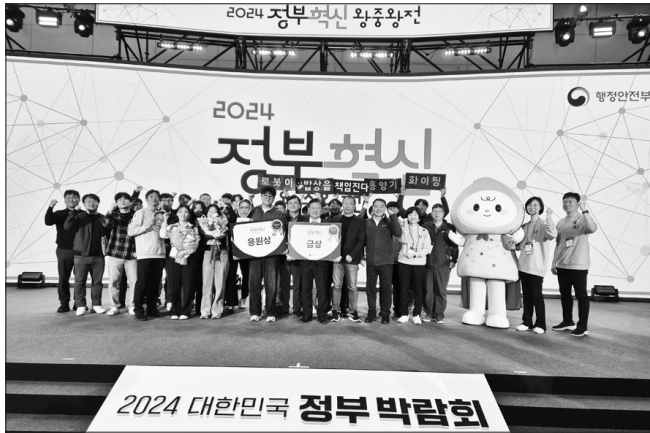
농촌진흥청이 지난 14일 광주광역시 김대중컨벤션센터에서 개최한 행정안전부 주관 '2024 정부혁신 왕중왕전'에서 '노동력 부족, 이제 농업로봇이 해결한다'로 대통령상 '금상'을 수상했다.

부, 문제를 해결하는 정부, 디지털로 일하는 정부)로 나눠 예산과 본선을 치르는 방식으로 진행됐다. 전 중앙부처, 지자체, 공공 기관으로부터 총 647개 사례를 추천받아 예산을 통과한 13개 우수 사례가 왕중왕전 본선에 진출했다.