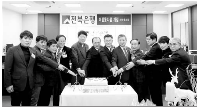
전북은행은 군산시 미장동에 전북은행 100번째 점포이자 군산지역 12번째 점포인 미장동지점을 오픈하고, 4일 개점식 행사를 진행했다.

의 몫으로 남는다. 한 소비자는 "만약 할부이자를 낸다는 사실을 알았다면 일시불로 기기를 사고 별도로 요금제약정할인을 넣든가 했을텐데 약정 혜택인양 속여 수수료를 물리는 건 소비자 기망"이라고 지적했다. 지난해 11월 1일 국회 미래창조과학방송통신위원회 소속 최명길 의원(더불어민주당)은 통신사가 이용자에게 휴대전화 할부구매를 강요할 수 없도록 하는 단말기 유통구조 개선법(단통법)을 대표 발의했다. 개정안은 단말기 대금의 일시불 결제 요구를 거부한 통신사에게는 과징금을 부과하고, 판매점은 과태료 처분하는 내용을 담았다. 법안이 통과되면 일시불 결제가 가능해져 원치않는 할부비용을 내는 사례가 줄어들 것으로 예상된다. /인재용 기자