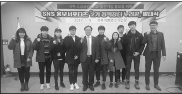
전북중소기업청은 4일 SNS 홍보포터즈 '2기 정책장터 누리꾼' 발대식을 가졌다.

다양한 활동을 한 1기 정책장터 누리꾼들의 활동이 12월로 끝남에 따라 그간의 활동내용을 점검·보완해 2기 정책장터 누리꾼 계획을 수립하고 1차·2차 심사를 통해 15명의 대학생들을 최종 선발했다. 이번 발대식은 '2기 정책장터 누리꾼'의 본격적인 활동을 알리는 행사로써, 누리꾼들은 발대식을 마치고 전북중기청에서 진행된 중소기업 지원정책 합동설명회에 참여하고 홍보하는 활동을 시작했다. 전북중기청은 지역 대학생 15명으로 구성된 '정책장터 누리꾼'을 활용해 관(官) 주도의 일방향적인 홍보에서 탈피, 고객·민간 중심의 쌍방향적 홍보를 통해 중기청 정책 안내 및 소상공인, 중소기업 인식개선 활동을 펼친다. 또한, 가정주부로 '맘스 시장누리꾼'을 구성해 명절을 앞두고 저렴한