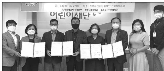
한전 전북본부는 초록우산어린이재단 전북지역본부, 전북종합사회복지관, 전주 남초등학교와 함께 지난 22일 어린이재단 전북지역본부에서 아동 놀이공간 조성을 위한 협약을 체결했다.

인근 골목길에 안전하고 친환경적인 놀이공간이 조성될 예정이며, 한전 전북본부 및 초록우산 어린이재단의 직원들이 뜻을 모아 놀이기구 조성에 필요한 재능기부도 할 예정이다.