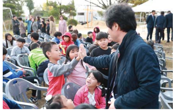
29일 임실 대리초등학교에서 청소년 놀이공간 '꿈터' 개장식이 열렸다.

한편 이번 승진대상자는 11월 11일부터 4주간의 승진 임용 전 기본교육을 거쳐 2020년 1월 이후 순차적으로 승진 임용할 예정이다. /장은성 기자