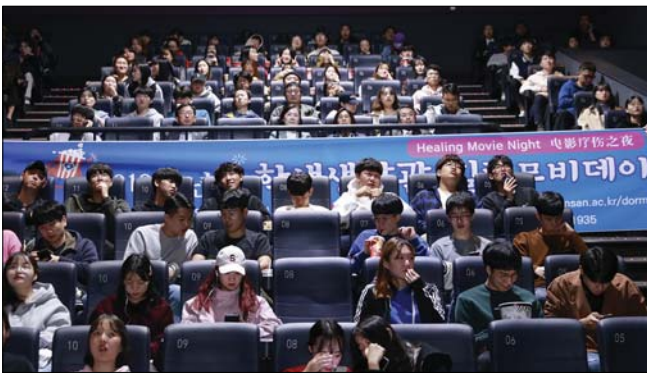
군산대학교 학생생활관이 최근 '힐링무비데이' 행사를 개최했다.

학생들은 "앞으로도 학생복지 차원에서 대학이 마련해주는 행사에 적극적으로 참여하겠다"고 즐거움을 표했다. /군산=김정훈 기자