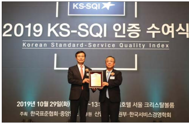
전북대학교가 한국표준협회가 주관하는 '2019 서비스품질지수 평가'에서 지방 국립대 가운데 1위를 차지했다.