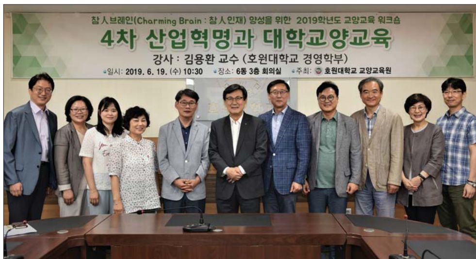
호원대 교양교육원에서 19일 6동 회의실에서 '4차 산업혁명과 대학 교양교육'이라는 주제로 2019 교양교육 워크숍을 개최했다.

도교육청 관계자는 "참학력 실장 등 전북 혁신정책 연구 지원 활동을 강화하고 교육현장의 필요를 반영한 교사를 양성해 교육과정의 혁신을 지원할 것"이라며, "대학과 교육청의 협업체제 구축으로 지속가능한 혁신지원 체제를 마련할 것으로 기대한다"고 말했다. /장은성 기자