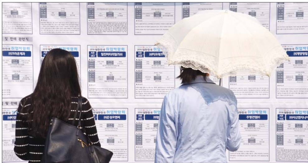
"어디에서 받아줄까?" 지난 23일 오전 서울 여의도 국회에서 열린 2016 대한민국 취업박람회 찾은 구직자들이 채용 공고게시판을 보면 일자리를 찾고 있다.