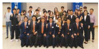
동남로타리클럽 대학생 43명에 장학금

전국연합학력평가가 다음달 11일 치러진다. 23일 전북도교육청에 따르면 전국 고등학교 3학년생을 대상으로 실시되는 전국연합학력평가가 다음달 11일 각 학교에서 치러지며, 이번 학력평가는 국어와 수학·영어·한국사·탐구·제2외국어 등이다. /고민형 기자