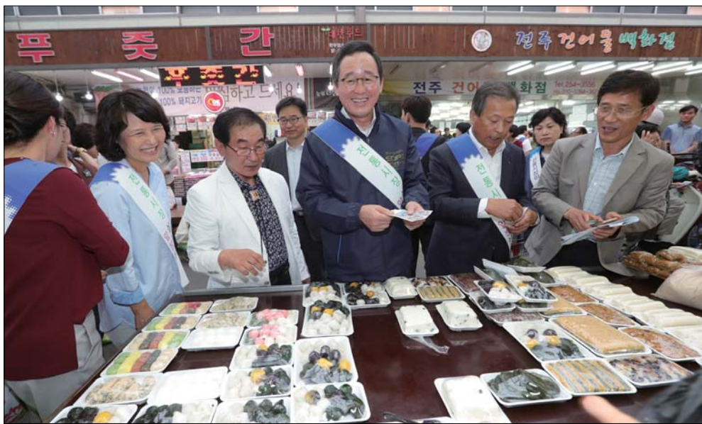
추석맞이 장보기 캠페인 송하진 도지사를 비롯, 이선홍 전북상공회의소회장과 도내 경제유관기관장은 12일 전주 신중양 시장을 방문하여 은누리상품권을 이용해 추석맞이 장보기 캠페인을 갖고 있다. 이날 구입한 물품은 예그린 지역아동센터에 전달했다.

도교육청에서는 11월17일 수능시험이 원활히 진행될 수 있도록 준비하고 있다.