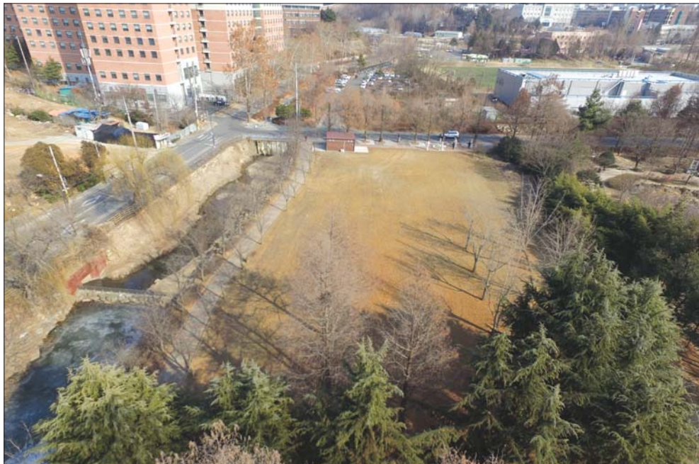
유니세프 아동친화도시로 인증받은 전주시가 덕진공원 내 옛 수영장 부지에 아이들이 맘껏 뛰놀며 자신들의 놀 권리를 몸으로 표현할 수 있는 아동친화공간인 '맘껏 놀이터(가칭)'를 조성한다.

간에서 자신들의 놀이 분위기를 맘껏 발산할 수 있도록 지속적으로 노력함으로써 아동의 놀 권리에 대한 인식 확산과 자기주도적인 놀이 문화 형성에 도 기여할 계획이다.