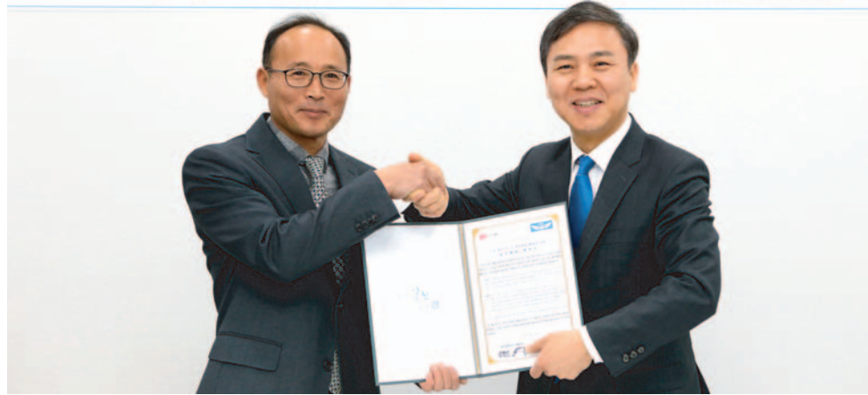
전주시와 새만금항공은 29일 '드론 재난구조 등 현장행정 활용을 위한 업무협약'을 체결하고 있다.

일시 : 2018. 1. 29.(월) 10:00 장소 : 새만금항공(주) 2층