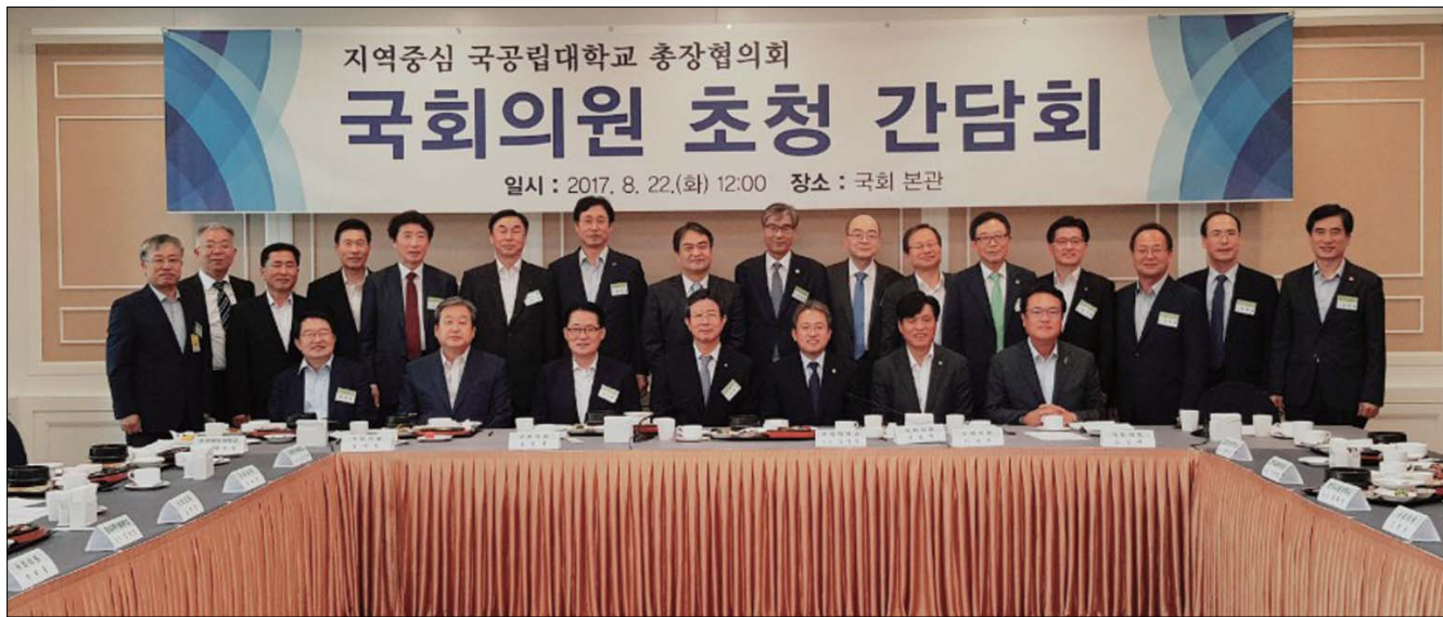
군산대학교 등 19개 지역중심 국공립대학교로 구성된 지역중심국공립대총장협의회가 최근 전국 19개 회원 대학 총장들과 이들 대학이 소재한 28개 지역구 국회의원들이 참석한 가운데 국회 본관 3층 식당에서 간담회를 가졌다.