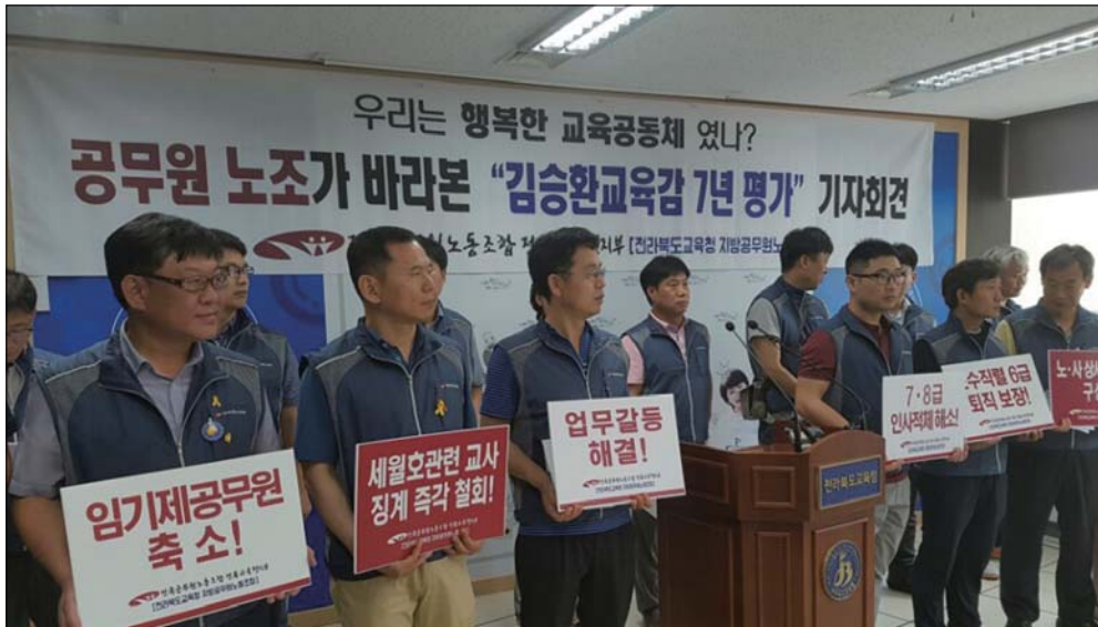
공무원 노조가 바라본 김승환 교육감 5일 전국공무원노동조합 전북교육청지부는 전북도교육청에서 '공무원 노조가 바라본 김승환 교육감 7년 평가' 회견을 열고 불통행정과 임기제 공무원 과다 임용 등을 꼬집었다.

학교폭력 예방 및 대응 실적이 있는 교원에겐 교육감이나 그 밖의 명부작성권자가 부여하는 가산점도 현행 연 0.1점에 총합계 2.00점까지 받을 수 있었으나 앞으로는 연 0.1점에 총합계는