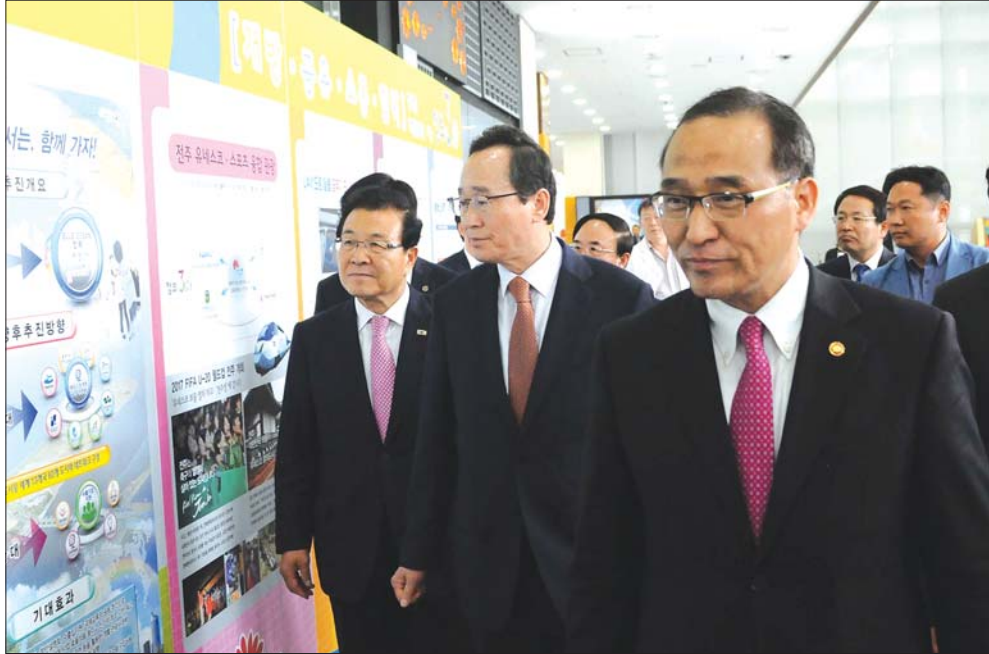
전북 찾은 행정자치부 장관

27일 전북도와 행정자치부가 전주 국립무형유산원에서 '도민과 함께하는 정부3.0 국민체감 토크마당'을 개최한 가운데 홍윤식 행정자치부 장관과 송하진 도지사, 도내 시장·군수 등이 정부 3.0 성공사례를 살펴보고 있다.