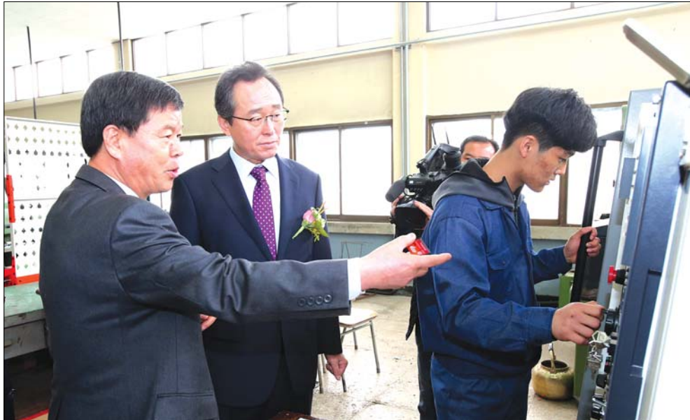
전북도 기능경대회 개최 6일 제46회 전라북도 기능경대회이 전주공업고등학교에서 개최되는 가운데 송하진 도지사가 대회전 경기장을 방문해 감독관과 시합장을 둘러보고 있다.

또한 야시장 운영으로 연간 75~80명 가량의 일자리가 생겨나며 지역 고용 문제 해소에도 일익을 담당하고 있다.