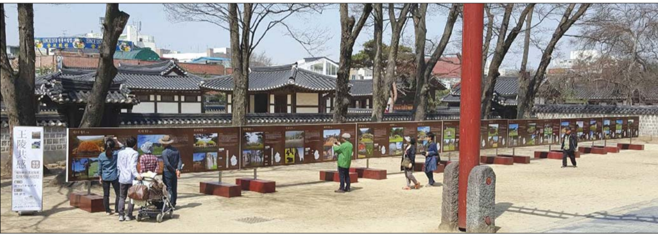
500년 조선왕조의 발상지인 경기전에서 세계유산으로 등재된 조선왕릉을 한 눈에 살펴볼 수 있는 사진전이 열린다.

전북도교육청이 고·2학년생을 대상으로 한 방과후학교 하이클래스 독서-철학 성장 프로그램을 개설한다. 4일 도교육청에 따르면 통합 교과적 사고를 통한 범교과적 독서능력 확충과 대입 경쟁을 앞둔 학생들의 차별화된 학교생활 활동을 위해 '하이클래스 독서-철학 성장 프로그램'을 방과후학교 형태로 개설한다. 희망 학생 신청으로 전주와 군산·익산 등 3개시의 거점학교에서 운영될 이번 프로그램은 인문반과 자연반을 구분해 12개 학급 240명 규모로 운영할 계획이다. 운영기간은 오는 5월부터 11월까지 매주 일요일 오후2시~5시까지 20주, 60시간이 개설된다. 수강시간의 80%를 이수한 학생에게 수료증을 발급하며 학교생활기록부 교과학습발달상황 '세부능력 및 특기사항'란에 수료 내용을 기재할 수 있도록 할 계획이다. 전체 모집인원의 60%는 고1, 나머지 40%는 고2로 구성하며 모집인원이 초과할 경우, 면접시험을 치를 계획이다. /고민형 기자