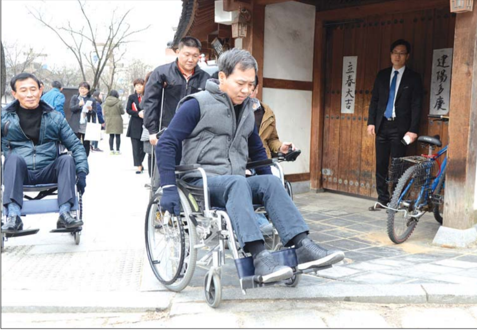
휠체어 타기 김승수 전주시장이 16일 전주 한옥마을에서 전주시장 장애인단체 임원들과 함께 휠체어를 타고 장애인들이 겪는 불편함 등을 체험하고 대책마련에 나섰다.(관련기사 4면)

여름철 집중호우에 침수피해가 자주 발생했던 전주 송천동 농수산물시장 주변이 침수 걱정 없는 안전한 지역으로 탈바꿈된다. 16일 전주시에 따르면 상습 침수피해 지역 주민들의 소중한 인명과 재산을 보호하기 위해 오는 2018년 말까지 송천동 농수산물시장 주변 저지대에 우수저류시설을 설치하는 송천1지구 우수저류 설치사업을 추진할 계획이다.