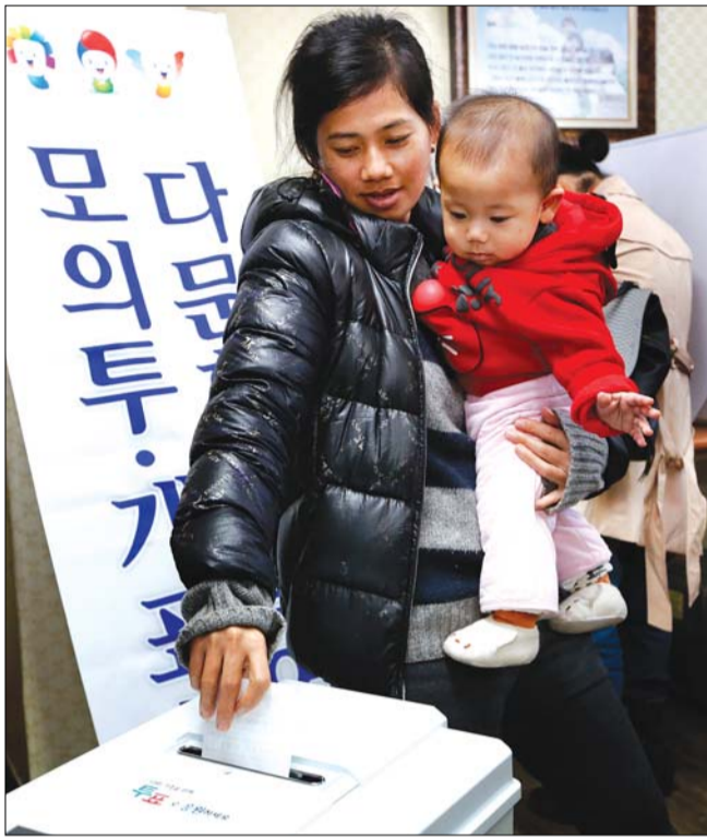
다문화가족 선거 체험 모의투표 전주시다문화가족 선거 체험교육이 9일 중앙시장 옆 다문화가족지원센터 사무실에서 열린 가운데 선거이론교육을 마친 한 결혼이주여성들이 모의 투표를 하고 있다.