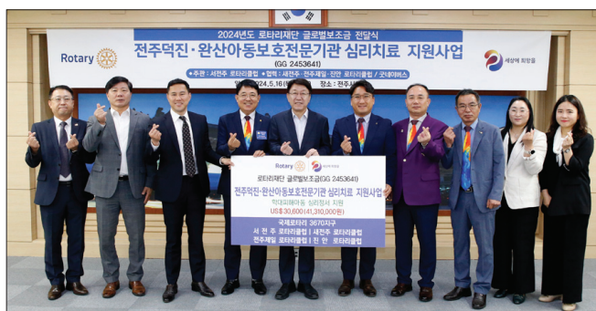
국제로타리 3670지구 소속 서전주·새전주·전주제일·진안 등 4개 로타리클럽은 16일 확대 피해 아동들을 위해 써달라며 전주시에 4100만 원 상당의 후원금을 기탁했다.

이와 관련 시는 단일 시·군 중 최초로 2곳의 아동보호전문기관을 운영하고 있다. 전주덕진·완산아동보호전문기관은 확대 피해 아동 및 가족의 치료와 아동학대 재발 방지 등 사례관리, 아동학대 예방사업 등의 업무를 활발히 수행하고 있다.