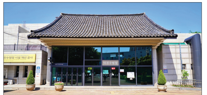
전주 덕진수영장이 대대적인 시설 개선을 마치고 재개장한다.