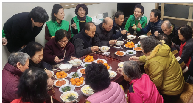
전주시 완산구 중앙동 새마을부녀회에서는 새해를 맞아 9일 관내 중앙경로당을 찾아 40여 명의 어르신에게 떡국으로 점심을 대접했다.