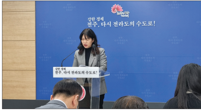
전주시가 올해 대한민국 대표 문화도시로 대도약하기 위해 문화예술·관광·체육 분야의 다양한 복합시설을 조성해 시민과 예술인, 관광객에게 제공하기로 했다. 사진은 9일 열린 문화체육관광국 신년브리핑.

특히 시는 올해 민선8기 공약사업 '의공원 프로젝트'의 일환으로 △왕의궁원 마스터플랜 수립 △국립 후백제 역사문화센터 건립 △전주 고도(古