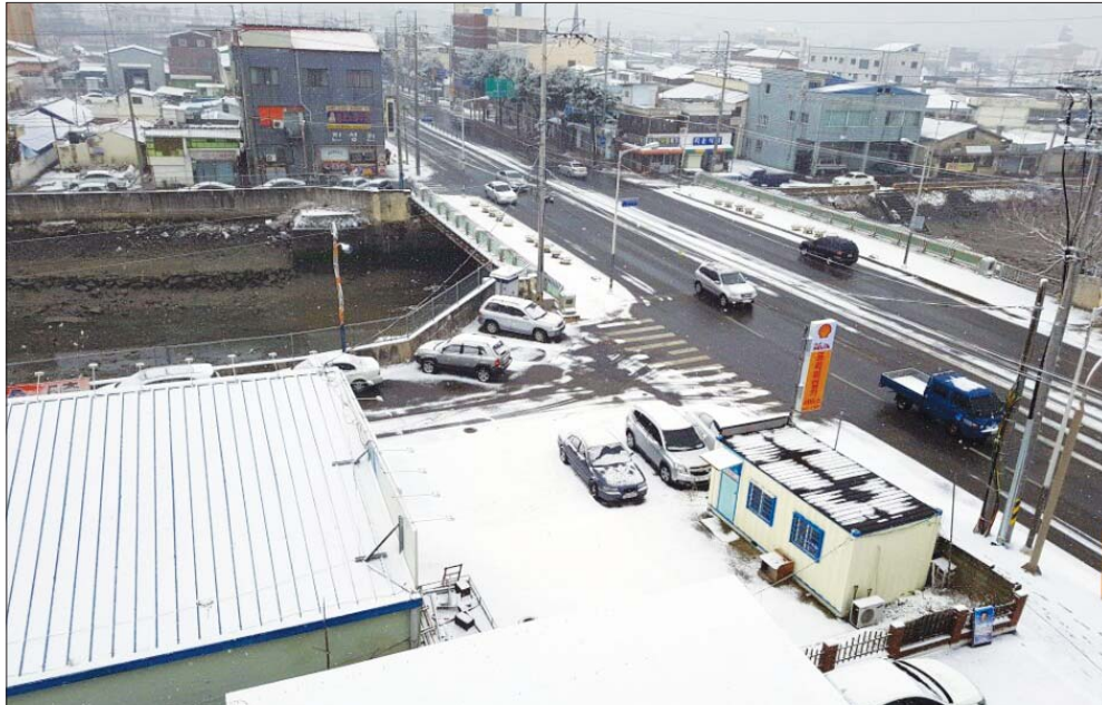
은빛 세상으로 변한 시가지

노후공동주택관리비용 지원사업은 옥상방수와 외벽도색 등 아파트 내구성 향상을 위한 보수공사와 단지 내 담장 철거 후 조경 식재, 도로, 주차장 등 부대시설의 보수, 지하주차장 LED 전 등 교체 등에 필요한 비용의 일부를 지원하는 사업이다. 시는 20세대 이상 노후공동주택에 대해서는 총 5억원의 예산을 편성해 사업비의 70%, 최고 2000만원까지 지원한다. 또한 시는 올해 기존 노후공동주택 관리비용 예산 외에 별도로 연립주택과 다세대 주택 등 5세대 이상~19세대 이하의 소규모 공동주택 주민들을 위한 시설보수에 필요한 사업비의 80%이하로 최고 2000만원까지 시설 보수 및 정비를 위한 비용을 지원할