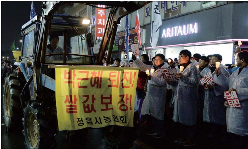
박근혜 퇴진! 쌀값 보장!

전주시가 아동청소년센터 건립을 통해 청소년들의 건전한 여가활동 돕기에 나섰다. 시는 15만 전주시 청소년들의 활동역량 개발과 문화 활동 참여기회를 확대하고 청소년시절에 네트워크 체계구축·관리 및 프로그램 개발 등을 위해 청소년시설을 총괄하는 아동청소년센터 건립을 추진한다고 1일 밝혔다. 아동청소년센터가 들어서면 전주시 청소년들의 문화활동 공간이자 재능개발 공간으로 활용돼 청소년들의 건강한 성장을 지원하는 것은 물론 인근 주민들도 문화생활을 영위할 수 있어 삶의 질이 크게 개선될 것으로 기대된다. 나아가 아동의 인권과 권리 존중에 대한 교육 및 정보제공과 보육교사 교육 및 아동에 위한 각종프로그램 개발 등을 통해 아이들이 행복한 아동친화도시 조성에도 한 걸음 더 다가갈 수 있을 것으로 전망된다. 아동청소년센터 건립 예정부지는 덕진구 이후동 이중택지개발 부지 내 시유지로 시는 오는 2018년 개관을 목표로 총 60억원을 들여 지하층 지상 3층에 연면적 3,000㎡ 규모의 건물을 지을 계획이다. 센터 내에 공연장과 상담실 강의실, 동아리방, 진로직업체험실 등의 청소년시설을 갖춘 예정이다. 또 아동청소년 심리상담실, 아동프로그램개발실, 어린이 전용 도서관 등의 이용를 위한 공간도 운영된다. 이를 위해 전체 건립예산 60억원 중 설계비 3억원을 확보한 상태로 설계공모를 진행하고 있다.