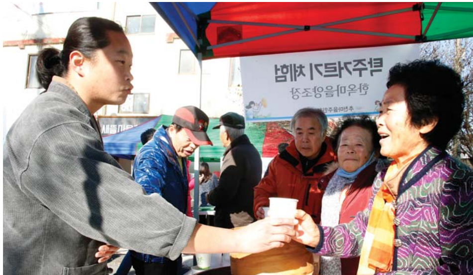
마을공동체 발전을 위한 팔복새마을 축제가 29일 전주시 팔복새마을회관 앞에서 열린 가운데 축제장을 찾은 주민이 직접 만든 탁주를 시음하고 있다.

전주 팔복새마을축제 김장 나눔·전시회 마을 노래자랑 등 진행 지역주민 화합 도모