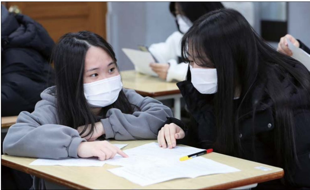
'수능 성적표 바라보는 수험생들' 2021학년도 대학수학능력시험 성적표 배부 날인 23일 전주근영여자고등학교에서 수험생들이 성적표를 확인하고 있다.

전북대학교(총장 김동원)는 2021학년도 대학 편입학 전형을 통해 총 519명(일반편입 419명, 농어촌학생 12명, 기회균형선반 7명, 특성화고졸생 1명, 특성화고졸재직자 4명, 학사편입 76명)을 모집한다고 밝혔다. 원서접수는 오는 28일부터 31일까지다. 2021년 1월 28일 필답·면접·실기고사를 실시, 2월 8일 합격자를 발표할 예정이다. 지원자격은 일반편입학의 경우 일반대학(4년제) 2학년 이상 수료자 및 전문대학 졸업자이고, 학사편입학은 일반대학(4년제) 졸업자로서 전북대 3학년으로 편입학하게 된다. 전형요소는 공인영어시험 성적, 전적대학 성적, 면접고사, 필답고사 및 실기고사 등을 반영한다. 자세한 선발기준은 입학본부 홈페이지( http://enter.jnu.ac.kr ) 모집요강을 참조하면 된다. /정은성 기자