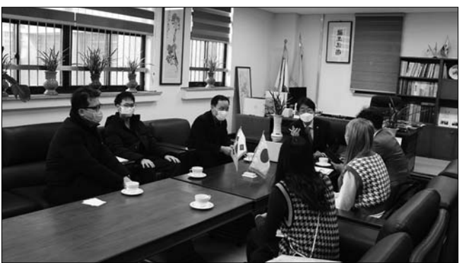
전북대학교 치과대학은 최근 일본 북해도대학과 국제교류의 시간을 가졌다고 30일 밝혔다. 올해는 북해도대학에서 교수와 학생들이 전북대 차대를 찾아 교류 행사가 이뤄졌다.

되는 이번 설명회의 질의응답 과정에는 토론자 외에도 웨비나에 접속한 모든 이들이 자유롭게 참여해 의견을 나눌 수 있다. 또한 웨비나 녹화본은 편집을 거쳐 유튜브에 게시되므로 실시간으로 접속하지 못하더라도 유튜브에서 '동남아지역동향설명회'로 검색해 언제든 다시 볼 수 있다. 한편 설명회에 참가하기 위해서는 사전 등록이 필요하다. 전북대 동남아연구소 홈페이지와 페이스북을 방문해 사전 등록 양식을 제출하면 설명회 당일 이메일로 Zoom 링크를 받아볼 수 있다. /정은성 기자