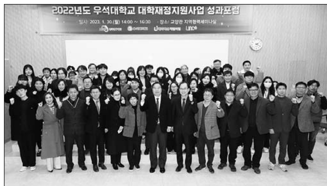
우석대학교는 30일 전주캠퍼스 교양관 지역협력세미나실에서 2022학년도 대학재정지원사업 성과 포럼을 연 가운데, 관계자들이 기념촬영을 하고 있다.

도록 최선을 다하겠다"고 밝혔다. 라서현 대표는 "자녀 내 리빙랩 관련 우수 인재들을 배출하고 있는 전주대 미래융합대학과 협력해 우수 인재들이 도내에서 자립할 수 있도록 돕겠다"고 밝혔다. /정은성 기자