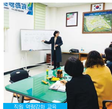
직원 역량강화 교육

▲'고인돌 일자리 창출단' 소개를 부탁드립니다 고창지역 구직희망자와 비경제활동 인구(전업주부, 청년 등)를 찾기 위해선 마을 현안