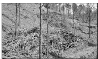
산림작업 후 임지에 남겨진 부산물.

전북도가 산림청의 '2022년 미이용 산림자원화센터 조성사업' 공모에 최종 선정돼 30억 원의 사업비를 확보했다고 9일 밝혔다. 이번 공모에 전북도와 남원시가 공동 대응해 30억 원의 사업비를 확보하며, 도는 탄소중립 실현에 한층 더 다가갔다. '미이용 산림자원화센터 조성사업'은 벌채나 산불·병해충 피해 등으로 발생하는 가지, 줄기 등의 목재 부산물을 펠릿, 표고 톱밥 배지, 목사·과수원 깔개, 신재생 연료용 공급을 위해 수집·가공·유통 시스템을 구축