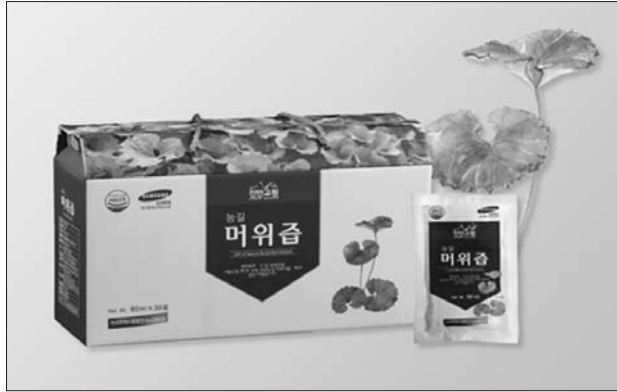
전북도는 2021년 심심산골나물산업 육성사업의 첫 성과물로 진안군에서 생산한 '머위즙'을 출시한다.

대부분 버려졌으나, 이번 사업으로 머위잎을 활용한 건강식품으로 재탄생돼 나물사업의 성공적인 출발을 알렸다.