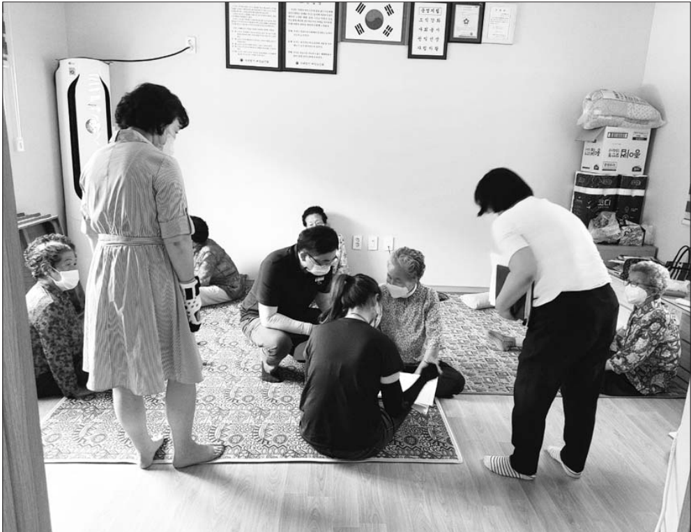
전북도가 코로나19와 계속되는 무더위에 폭염피해 예방을 위해 수급자 등 위기가구, 노인, 장애인 등 취약계층을 대상으로 맞춤형 폭염대책을 추진한다.

전북도가 코로나19와 계속되는 무더위 폭염피해 예방을 위해 수급자 등 위기가구, 노인, 장애인 등 취약계층을 대상으로 맞춤형 폭염대책을 추진한다. 먼저, 도는 노인·장애인 등 취약계층을 위해 경로당, 복지회관 등 평소 자주 활용하고 쉽게 이동할 수 있는 곳 4,547개소를 '무더위 쉼터'로 지정해 9월까지 운영하고 있다. 무더위 쉼터는 열대야 발생 시 야간에도 이용할 수 있도록 개방하고, 방역관리자를 지정해 방역물품 비치, 쉼터 내 취식 금지 등 방역수칙 준수 여부를 상시 점검하도록 했다. 아울러, 이동이 불편한 거동 불편자 및 독거노인들에게는 인부 전화와 직접 방문을 통해 건강 체크 등 특별 관리를 실시하며, 기온이 가장 많이 높은 시간대인 오후 2시부터 5시까지는 논밭에서 작업하는 것을 금지하고, 마을 이장을 통해 순회 활동을 강화하고 있다. 또한, 위기가구 및 노숙인 보호를 위해 단전, 단수, 사회보험료 체납 등의 다 기관 정보를 활용해 폭염, 코로나19 등으로 실직한 위기가구 등을 발굴, 긴급 복지비 등 사회 보장급여를 지원하며, 주간 순찰반 편성을 통한 순찰 강화와 마스크 등 방역물품과 식음료 제공 등 노숙인 보호에도 앞장서고 있다.