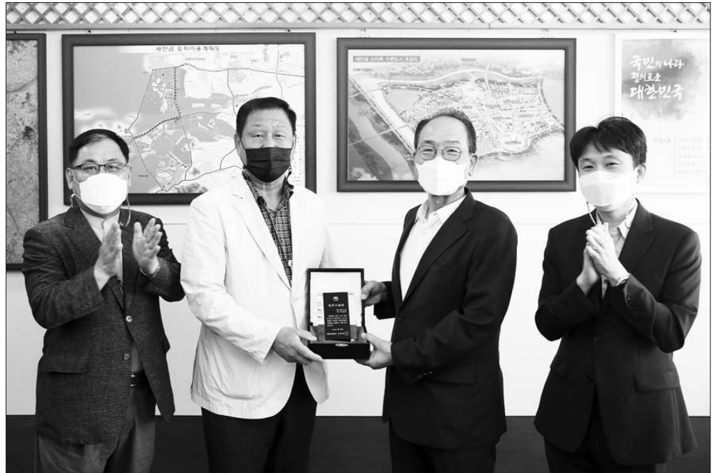
새만금개발청은 구조·구난용 특장차량 제조 전문기업인 ㈜평강비아이엠과 새만금 국가산업단지 입주계약을 체결했다.

박성호 도 산림복지과장은 "앞으로도 도내 많은 임업인 및 생산자 단체에서 산림소득 공모사업 참여하여 선정될 수 있도록 사업설명회, 현장컨설팅 등을 적극적으로 실시하겠다"고 밝혔다. /유호상 기자