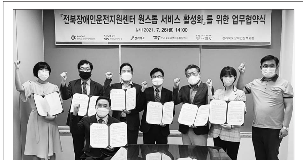
전북도가 TBN 전북교통방송 공개홀에서 전북운전면허시험장, TBN 전북교통방송, (사)더불어함께새희망, 전북도장애인정책포럼, 전북도장애인복지지원센터 등 5개 기관과 '전북장애인운전면허 취득 원스톱 서비스 활성화'를 위한 업무협약을 체결했다.

안 행정6급 각 1명, 김제농업 6급 1명)으로 구성됐다. TF팀은 지난 1차 행정협의회에서 좋은 결과를 얻었던 경험을 살려 새만금 관련지자체간 협력과 논의가 필요한 안건을 발굴하고, 발굴된 안건의 필요성과 협의 가능성 등을 검토한 후 제2차 행정협의회 안건으로 선정할 방침이다. 전북도 관계자는 "새만금은 전북도 전체의 발전이라는 큰 틀에서의 접근이 필요하다"며 "새만금행정협의회 운영이 새만금의 속도감 있는 개발로 이어질 수 있도록 긴밀한 협조체계를 구축하겠다"고 말했다. /유호상 기자