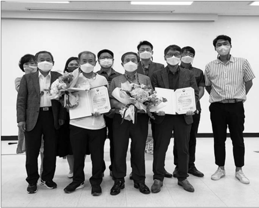
'전북농어촌종합지원센터'가 제9회 '도농교류의 날' (7.7)을 맞아, 전북도 삼락농정 중 '사람찾는 농촌'을 구현해 온 활동성과를 인정받아 농림축산식품부 장관상을 수상했다.

전북농촌관광 대표상품으로 최대 50%의 체험비를 지원하는 '농촌관광여행'은 60개의 농촌체험마을이 인증·운영하고 있다.