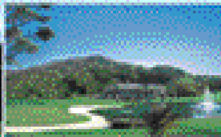
전세계 자연 경관 - 무주덕유산CC