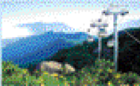
설악을 감상하기 위한 - 무주능선 곤도라

관광콘도라 이용시 대기 시간을 줄이고 고객님의 편의를 위해서 주말, 공휴일에 한하여 사전 예약제로 운영(10월~2월말) 청소년들이 자연과 친숙해지고 건전한 야외활동을 갖게 하기 위하여 무주덕유산리조트 내 유스호스텔 신축