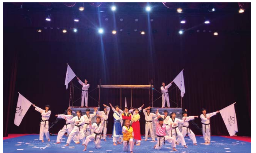
↑ 태권도 시범공연(매일 2회 공연, 오전 11시·오후 2시)