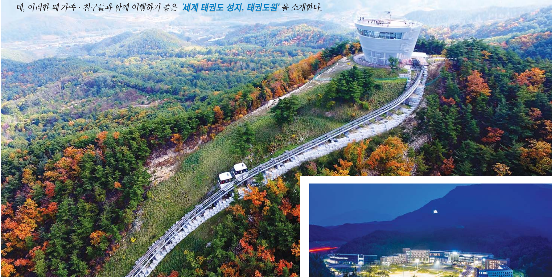
↑ 태권도원 전망대와 모노레일 일대의 가을.

어느덧 가을로 접어들었다. 지난 여름의 무더위를 생각해 보면 성큼 다가온 가을이 반갑기만 한데, 이러한 때 가족·친구들과 함께 여행하기 좋은 '세계 태권도 성지, 태권도원'을 소개한다.