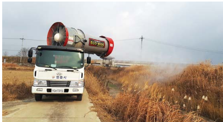
꾸준히 실시하고 있는 방역 활동.

악성 전염병 근절에도 총력을 쏟는다. 최근 지속적으로 발생하고 있는 악성 가축 전