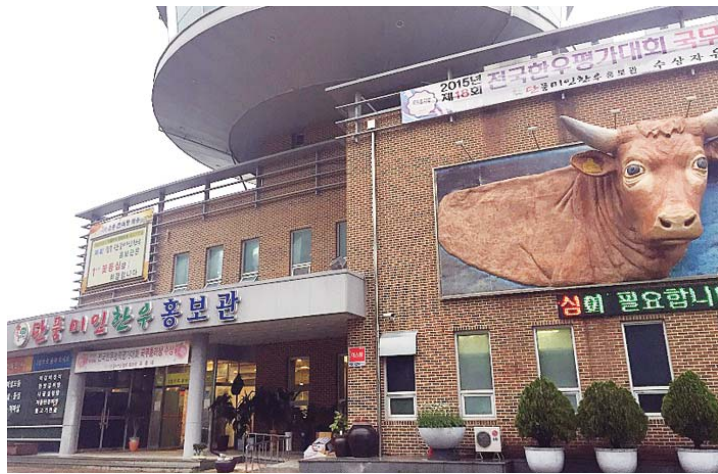
유통활성화. 사진은 단품미인 한우 홍보관.