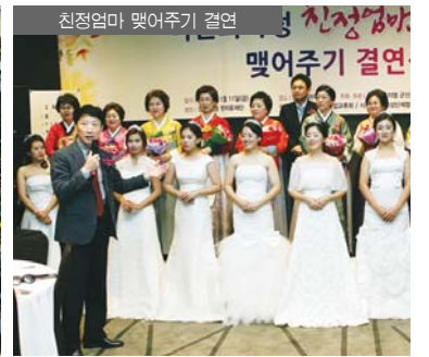
친정엄마 맺어주기 결연