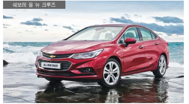
쉐보레 올 뉴 크루즈