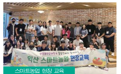
스마트농업 현장 교육

한편 시는 청년농업인의 유입을 통한 후계농업인력 양성을 위해 한국농수산대학교와 산학협동을 통해 청년농업인들이 대학에서 농업에 대한 전문지식을 습득할 수 있도록 지원하고 있다. /익산=이재훈 기자