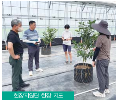
현장지원단 현장 지도

시는 청년농업인의 역량강화에도 힘쓰고 있다. 연 10회 진행되는 현장중심형 교육을 통해 지역 우수농장을 견학하고 다양한 농촌융복합 산업 등 성공사례 분석의 기회를 제공한다. 농업전문가, 선도농업인 등 현장지원단에게 애로사항이나 문제점 대응방안을 제시하고 영농기술을 공유한다.