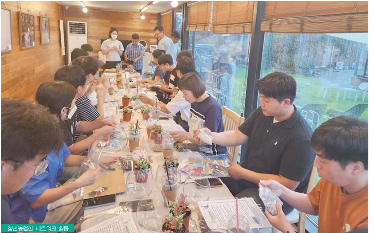
청년농업인 네트워크 활동