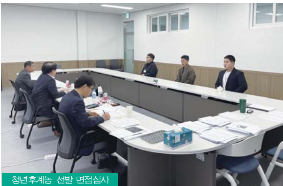
청년후계농 선발 면접심사