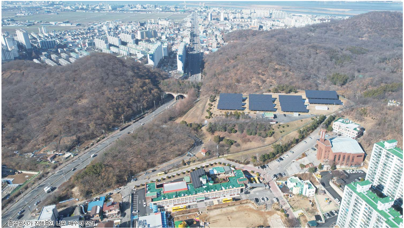
증설공사가 진행중인 내운 배수지 정전.

▲상수도 시설의 선제적 개선과 효율적 운영관리 시는 노후관 교체 등 지방상수도 현대화사업을 추진해 유수율을 높이고 물 낭비 요인을 최소화할 수 있도록 더욱 깨끗한 물을 공급한다. 지방상수도 현대화사업은 지난 2019년부터 오는 2024년까지 6개년에 걸쳐 총 685억원을 투입해 불량수도관 89.4km를 교체하고, 상수관망 블록 및 유지관리 시스템 구축 등 상수도 시설을 현대화하는 사업이다. 그간 조촌, 경암, 경장동 일원의 노후관로 16.3km를 교체했으며 올해에는 본격적으로 지곡, 조촌, 경암동 일원의 노후관로 88.7km를 교체해 사업 대상자인 군봉 급수구역의 목표 유수율을 달성하고, 관망감시 및 원격제어 등 최적의 유지관리 시스템을 구축해 시설물을 효율적으로 관리할 방침이다. 또한, 수도 시설물의 안전한 운영 관리를 위해 시설물에 대한 정밀 점검 및 정기 안전점검을 실시하고 보수가 필요한 사항에 대해 보수·보강공사를 추진해 시설물의 효율성을 높여나갈 계획이다.