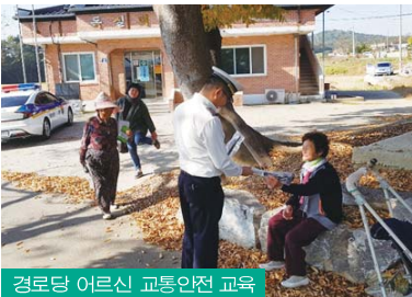
경로당 어르신 교통안전 교육

교통약자인 어린이의 교통안전을 위해 유관 기관 및 녹색어머니, 모범운전자 등과 초등학교 교별 순회캠페인 전개했으며 초등학교·유치원·학원 등 39개소 어린이 보호구역 지정과 시설개선사업을 완료해 어린이 교통사고 예방에 노력한 결과 단 한 건의 어린이 교통사고도 발생하지 않았으며 어르신, 다문화가정의 인구 비중 증가에 따른 맞춤형 교통사고 예방 방법과 위험성 등에 대한 찾아가는 교통안전교실을 내실있게 운영하는 등 교통약자의 교통사고 예방에 주력하고 있다.