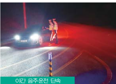
이간 음주운전 단속