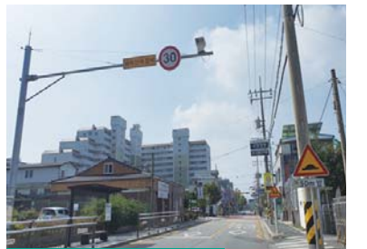
스쿨존 과속단속 카메라

교통약자 안전 위해 교통안전교실 내실화 윤창호법 제정 따라 시기·장소별 인력 배치 음주운전 단속 실시 정성스런 교통안전활동 결과 사고 사망자 감소로 이어져