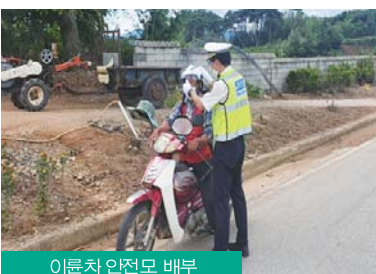
이륜차 안전모 배부