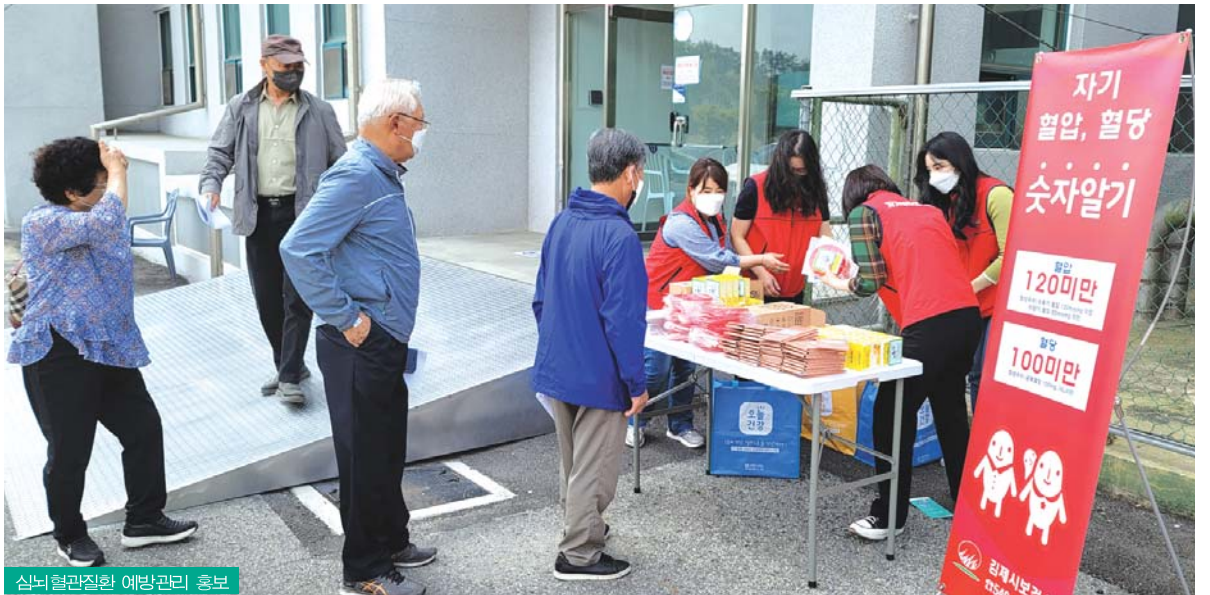
심뇌혈관질환 예방관리 홍보

또한 출산 준비에 어려움을 겪고 있는 초보 예비 부모들의 출산에 대한 두려움을 해소하고