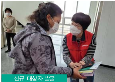
신규 대상자 발굴

담배연기 없는 지역사회 환경 조성을 위하여 금연클리닉을 통한 등록 관리상담 및 교육 등 서비스를 제공해 건강증진의 실천적 분위기를 만들어 건강하고 깨끗한 김제시로 정착하려고 한다. 청소년 흡연 예방 교육 및 아동 금연클리닉, 금연구역 지도·단속실시, 찾아가는 금연 건강캠프, 홍보·캠페인 등을 추진하고 있다.