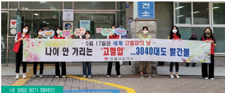
내 혈압 알기 캠페인