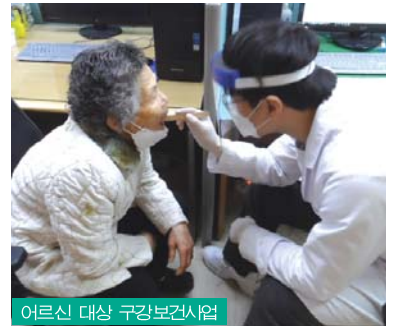
어르신 대상 구강보건사업