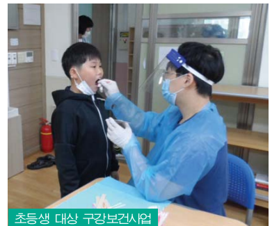
초등생 대상 구강보건사업