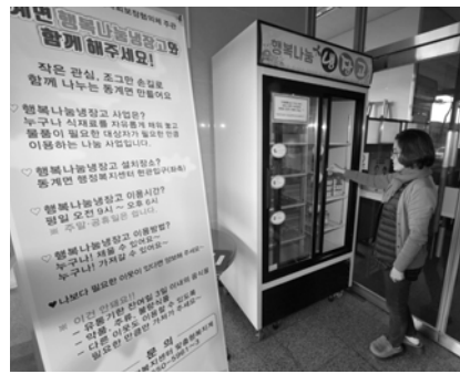
순창군 동계면 행정복지센터는 1층 현관에 행복나눔냉장고가 설치해 운영하고 있다.

순창군 동계면 행정복지센터 1층 현관에 행복나눔냉장고가 설치돼 지역민들에게 사랑을 베푸는 구심점이 되고 있다. 행복나눔냉장고는 동계면 지역사회보장협의체(이하 지사협)에서 설치한 것으로, 누구나 자유롭게 식재료를 채워 놓고 물품이 필요한 대상자는 필요양 만큼 가져갈 수 있게 했다. 식재료 나눔 사업의 일환으로 진행된 행복나눔냉장고로, 주민들은 그동안 어렵게만 생각했던 기부를 쉽게 실천할 수 있게 됐다. 이용방법은 간단하다. 평일 오전 9시부터 오후 6