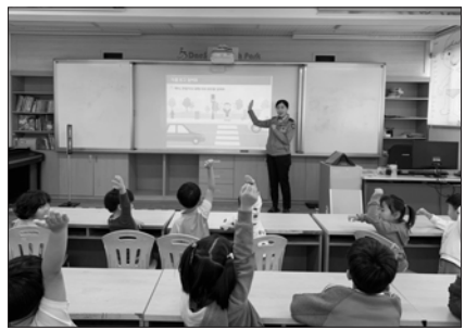
남원경찰, 찾아가는 어린이 교통안전교육 진행