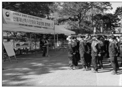
서부지방산림청, 지상진화 경연대회 개최

서부지방산림청은 최근 무주국유림관리소 진화훈련장 일원에서 서부지방산림청과 5개 국유림관리소 직원 및 특수진화대 등 110여명이 참석한 가운데 '산불재난특수진화대 지상진화경연대회'를 개최했다.