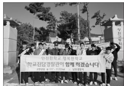
남원경찰서, 성원고 학생들과 학교폭력 예방 캠페인

사회망hil링펀드는 금융회사의 법인카드 포인트로 마련된 사회공헌기금 재원으로 신복위가 추진한 2019년 사회공헌사업 중 하나로 사랑의 달팽이(회장 김민자)와 함께 김제지역 내 독거노인돌봄 기본서비스를 받고 있으며 난청으로 어려움을 겪고 있는 65세이상의 저소득 독거노인에게 '독거노인 보청기 지원사업'을 마련했다. /김제=곽도태 기자