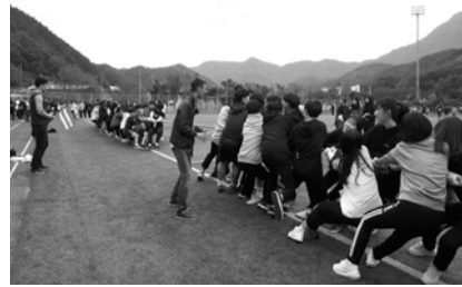
무주교육지원청주최로 '무주 고교연합 체육대회'가 최근 적상체육공원에서 열렸다.

학교 구분을 하지 않고 학생들이 섞여서 8개 팀으로 나눠 경기를 진행한 것은 이번 행사가 지역학생들 간에 소통의 폭을 넓히고 친목을 도모하는 부분에 주안점을 두었다는 것을 알려주는 대목이다. 무료 먹거리 부스를 이용하는 것도 다른 학교 학생들과 함께 찍은 인증샷 사진을 제시해야만 가능하도록 규칙을 정했다. 이렇듯 사상 처음으로 추진된 무주지역의 고교