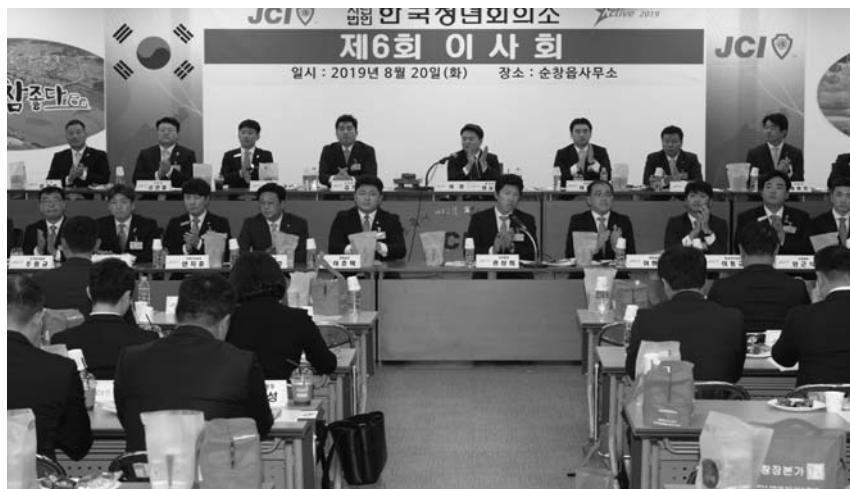
(사)한국청년회의소 제6회 상무위원회와 제6회 이사회가 지난 20일 순창군 순창읍사무소 대회의실에서 열렸다.

이어 주요 안건으로 ‘제141차 임시총회’에서 2020년 한국 JC 선거직 임원 선출의 건 등 4건의