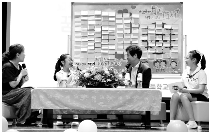
전주교육대학교군산부설초등학교에서 4~6학년 학생을 대상으로 ‘교육감님과 꿈 보따리 토크! 콘서트’라는 주제로 학생과 김승환 전라북도교육감이 의견을 나누는 진로체험 행사를 진행했다.

생활 속 궁금증과 함께한 주제별 토크 콘서트를 통해 다양한 얼굴 모습만큼이나 다양한 의견들이 있다는 사실을 체감할 수 있는 시간이 되었다.