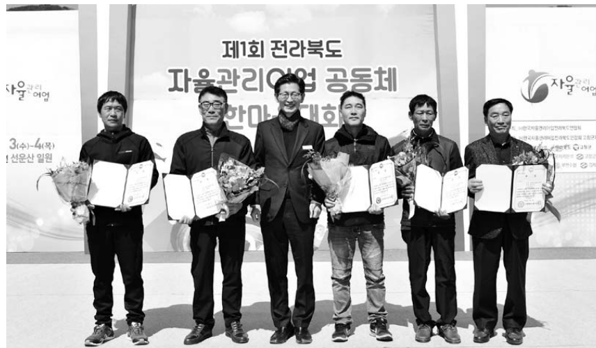
제1회 전라북도 자율관리어업인마음대회 가 3~4일 고창 선운산도립공원 일원에서성황리에 열리고 있다.

리어업 공동체가 어장관리, 수산자원관리, 어업인간 질서유지 등을 위해 더욱 노력해 주길 바란다"며 "고창군이 '농생명 식풍수'로 발돋움하기 위