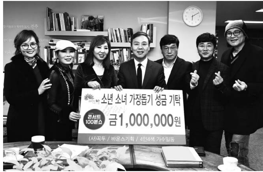
사단법인 꼭두와 전북권 연예기획사인 바운스기획이 생활이 어려운 소년·소녀 가장돕기 성금 100만원을 기탁했다.