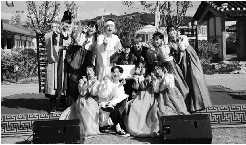
남원시가 위촉한 방송인 홍보대사들이 다양한 영역에서 톡톡 튀는 아이디어로 남원을 알리는데 앞장서고 있어 주목받고 있다.

다. '섬유도 아가씨'를 시작으로 2집 앨범 '장물뱅이'로 데뷔한 도씨는 5집 앨범 '지리산'을 발매하고 각종 행사장에서 민족의 명산 지리산을 소개하고 있다.