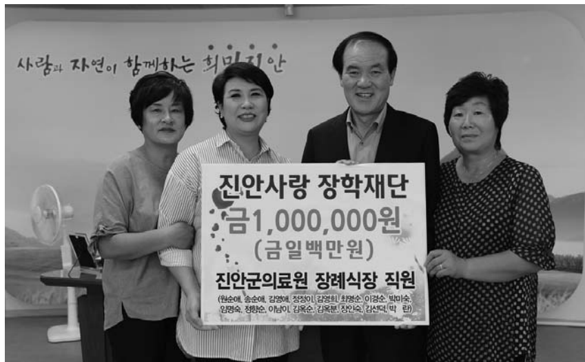
진안군은 농촌지역의 고령화와 인력부족에 따른 불편함과 과도한 장례비용을 줄여주기 위해 지난 2015년 3월 진안의료원 장례식장을 개장해 현재 운영 중이다. 사진은 진안의료원 장례식장 직원들이 군에 진안사랑 장학금을 기탁하고 있는 모습.