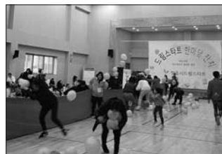
정읍시 드림스타트(이하 드림스타트)는 5일 곰두리스포츠센터에서 드림스타트 아동과 가족 160여명이 참석한 가운데 드림스타트 한마당잔치를 열었다.

드림스타트 관계자는 "드림스타트 가족이 활짝 웃으며 즐거운 시간을 보내는 모습을 보면, 앞으로도 아름다운 추억을 만들 수 있는 행사를 더 자주 마련하겠다"고 밝혔다.