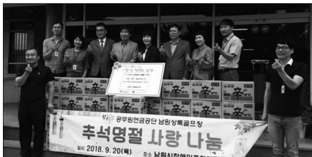
남원상록골프클럽-남원시장에인종합복지관 후원물품 전달

공무원연금공단에서 운영하는 남원상록골프장(대표 박종선)은 추석 명절을 맞아 최근 남원시장에인종합복지관을 찾아 100만원 상당의 후원물품을 전달했다.