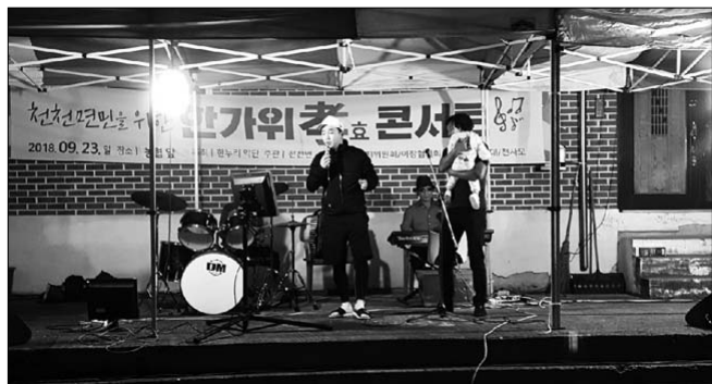
한누리악단, 천천면민과 함께하는 '효 콘서트'